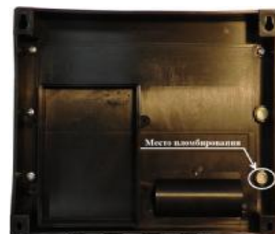
Рисунок 6 – Пломбирование тепловычислителя СПТ943