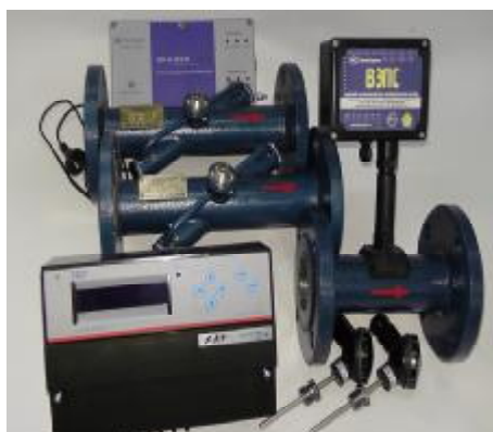
Рисунок 1 – Внешний вид теплосчетчиков модификации 01

Внешний вид теплосчетчиков модификаций 01, 02 и 03 представлен на рисунках 1, 2 и 3 соответственно.