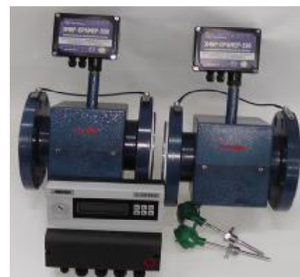
Рисунок 3 – Внешний вид теплосчетчиков модификации 03