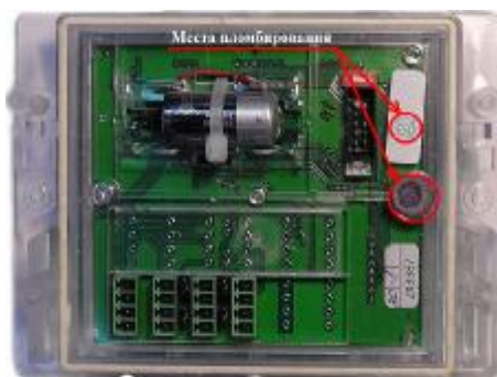
Рисунок 5 – Пломбирование тепловычислителя ВКТ-7