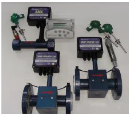
Рисунок 2 – Внешний вид теплосчетчиков модификации 02